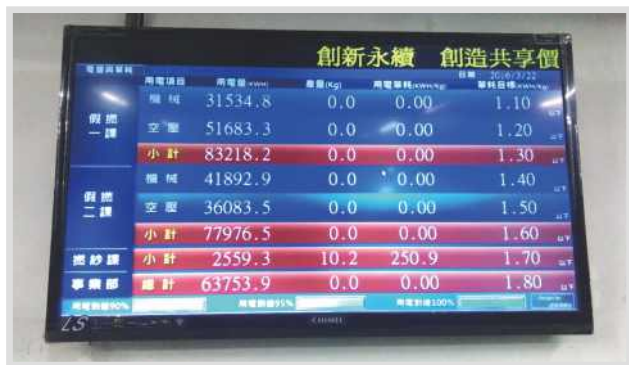
台灣南部某紡織廠《能耗看板裝置實例》